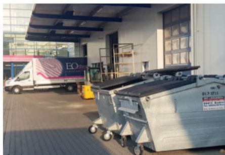
In Kombination mit den Abrollcontainern bieten die Umleerbehälter auf Rädern unseren Kunden EQTherm eine flexible Entsorgungslösung.