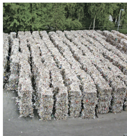
Fotos zeigen den Bellersheim-Recycling-Standort in Baden