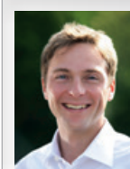
BELLERSHEIM Direktberatung Energie

Einige Anbieter haben schon ihre Preise erhöht. Vor allem die Anbieter, die bei den relativ niedrigen Preisen im Jahr 2016 viel Strom gekauft hatten, müssen nun teuer nachkaufen. Auch Bellersheim wird die Preise wohl anpassen müssen, da durch die steigenden Stromeinkaufspreise höhere Netznutzungsgebühren nicht aufgefangen werden können. Die Höhe der staatlichen Abgaben, wozu auch die EEG-Umlage gehört, steht für das Jahr 2019 zwar noch nicht fest. Meiner Meinung nach ist aber nicht von einer deutlichen Senkung auszugehen. Aber bis Ende des Jahres gilt sowieso unsere Preisgarantie. Und auch darüber hinaus werden wir mit Maß handeln, damit wir auch neuen Kunden unseren Strom günstiger als die Konkurrenz anbieten können.