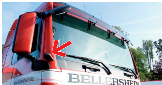
Ausgerüstet für eine sichere Fahrt.