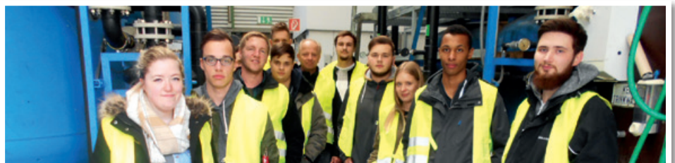
Auszubildende, Ausbilder und ein Praktikant verbrachten einen spannenden Tag am Standort Boden.