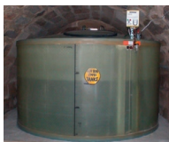
■ Standort-gefertigte Tanks